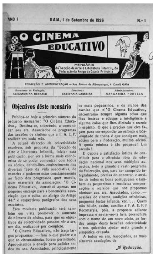
Figura 1 – Frontispício com o cabeçalho do N.º 1 de O Cinema Educativo (1926).

Com efeito, variados e notáveis são os esforços, em prol do cinema educativo, existentes na imprensa especializada (sobretudo na Invicta Cine – onde a vertente educacional é considerada «a grande função do cinema» 37 ) e nas associações culturais portuenses a partir dos anos 20. Numa revisão feita à generalidade das publicações periódicas especializadas em cinema 38 , verificamos que é apenas no Porto que se dedica uma publicação exclusiva a esta temática, de acordo com os dados a que tivemos acesso. O cinema educativo (Gaia; Porto, 1926-1928) foi um mensário, inicialmente surgido em Vila Nova de Gaia, editado pela Secção de