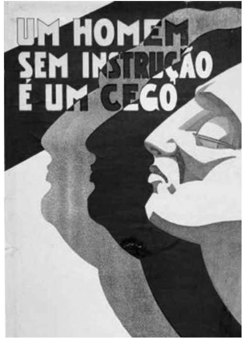
Figura 3 – Cartaz de propaganda à alfabetização. «Um homem sem instrução é um cego (...)», editado pela Federação dos Amigos da Escola Primária. Da autoria do caricaturista e maquetista António Cruz Caldas (assinado). Porto, 1929.

Seria preciso, todavia, esperar umas décadas para que o cinema educativo voltasse à ordem do dia e com projetos que saíssem do papel. Uma vez mais, o associativismo – desta feita desvinculado da escola – assumiu um papel preponderante neste processo,