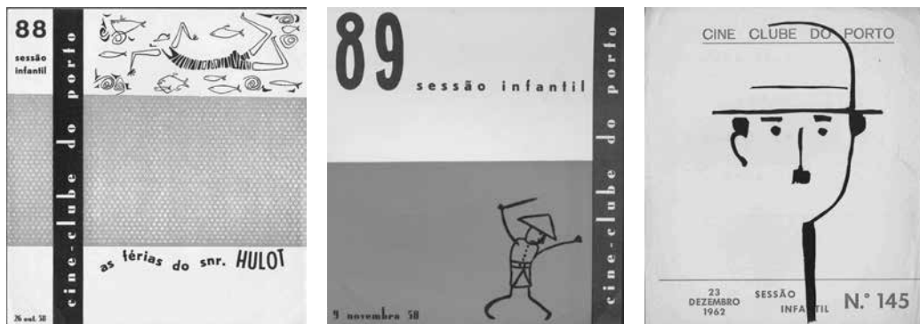
Figura 4 – Programa de sessão infantil do Cine-clube do Porto, N.º 88 (26 de outubro de 1958). Arranjo gráfico dedicado a Jacques Tati, da autoria de António Quadros.