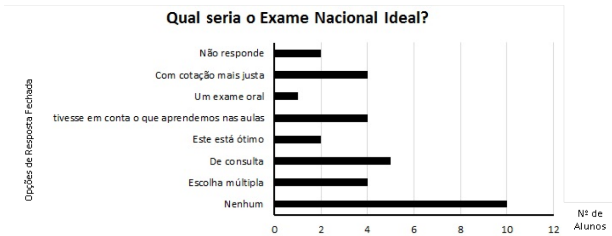
Gráfico 2 – Resposta à quinta questão do Inquérito por Questionário da Amostra

Para finalizar, tentou-se apurar qual seria, de acordo com a opinião dos estudantes, o exame ideal (Gráfico 2). De entre um grupo restrito de opções, observa-se um pequeno nível de abstenção dos alunos relativamente à questão. Contudo, a grande maioria respondeu que o exame ideal seria a sua inexistência, enquanto outros optaram por argumentar que seriam preferíveis exames com consulta ou que estes fossem apenas constituídos por questões de escolha múltipla. Realçam, ainda, que estes documentos de avaliação poderiam centrar-se mais nos conteúdos que efectivamente são lecionados nas aulas, bem como consideram que as cotações associadas a estas provas deveriam ser (re)distribuídas de uma forma mais justa, o mesmo se replicando certamente aos critérios de correcção e de classificação.