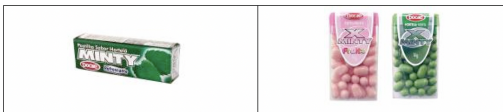
Figura 1. Minty e XMint.

Para analisarmos a formação da palavra da marca Xclé, devemos considerar a história de construção dessa palavra, cuja marca precursora é as Pastilha Minty, lançada em 2001, que faz alusão à menta. Em 2004, procurando traduzir o extremo sabor encontrado no produto, ao mesmo tempo em que busca a identificação com o público jovem que gosta de radicalizar, a marca evolui para XMint (Figura 1). O X estaria substituindo a palavra extreme (extremo/radical). Portanto, trata-se de formação por composição de duas palavras, extreme e mint , que também podem ser interpretadas como uma nova palavra.