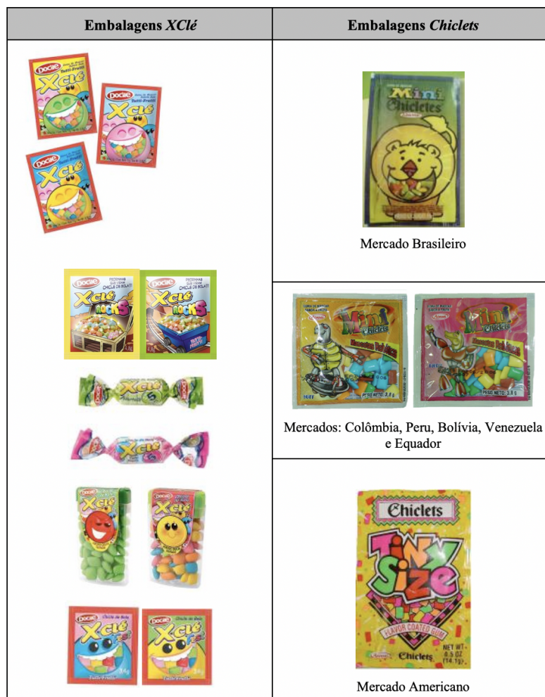
Figura 7. Algumas embalagens XClé e Chiclets disponíveis no mercado.

relativamente à presença ou ausência de instrumentos de delimitação instanciados por elementos que criam linhas divisórias, que conectam ou desconectam elementos da imagem, significando, por conseguinte, se esses elementos pertencem ou não ao conjunto. Assim, circunscrevendo a análise semiótica às três primeiras embalagens da marca XClé , do lado esquerdo, e à primeira embalagem da marca Chiclets do mercado brasileiro, do lado direito, da figura 7, procedemos à identificação de diferenças das marcas em disputa. A escolha destas primeiras embalagens segue um princípio relativamente aleatório, pese embora o facto de termos procurado embalagens das diferentes marcas com maior similitude.