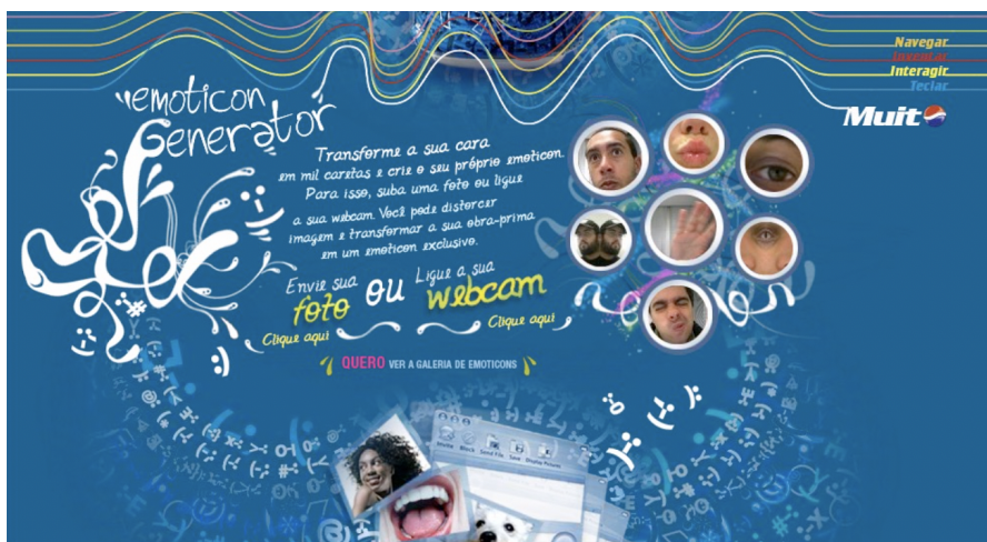
Figura 4. Pepsi emoticons ( emoji ).

evoluiu para as mais diferentes expressões emocionais mediadas pelo desenho. Os emoticons são ícones que revelam emoções e inúmeras empresas têm se apropriado deles para manter uma interação com os seus públicos, como a Pepsi (Figura 4). Programas especiais e dicas permitem que o usuário crie o seu próprio emoticons ( emoji ).