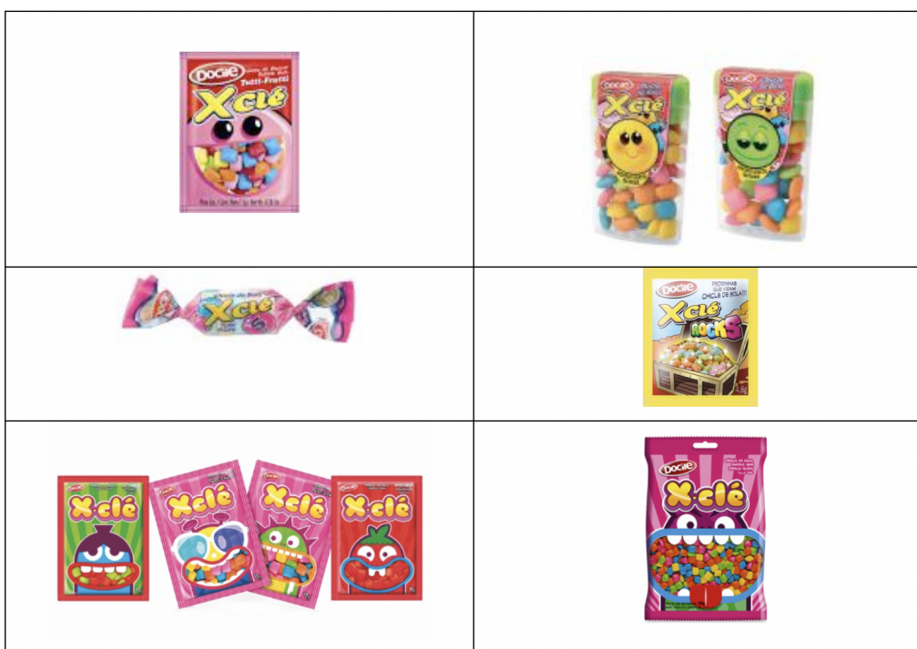
Figura 3. XClé.

E por estar em consonância com o comportamento (mutante) e linguagem infantil/jovem (o miguxês), ambos proporcionados pelos novos media , em 2006, ano em que é lançado um novo produto, o chicle, a identidade visual é construída a partir do X (extreme) aliado à partícula Clé, última sílaba da palavra de origem, transformando uma palavra de uso comum, chicle, em uma combinação verbo-visual original. Esta formação de palavra procura, deste modo, estabelecer simultaneamente uma comunicação ativa com os seus públicos por meio da estratégia de identidade visual mutante (marca mutante) 14 , cuja característica principal é o naming XClé, com alteração nos demais elementos da identidade visual, como a tipografia, a cor e os símbolos (Figura 3).