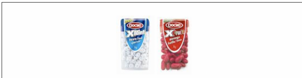
Figura 2. XMint e X Fruit.

E por estar em consonância com o comportamento (mutante) e linguagem infantil/jovem (o miguxês), ambos proporcionados pelos novos media , em 2006, ano em que é lançado um novo produto, o chicle, a identidade visual é construída a partir do X (extreme) aliado à partícula Clé, última sílaba da palavra de origem, transformando uma palavra de uso comum, chicle, em uma combinação verbo-visual original. Esta formação de palavra procura, deste modo, estabelecer simultaneamente uma comunicação ativa com os seus públicos por meio da estratégia de identidade visual mutante (marca mutante) 14 , cuja característica principal é o naming XClé, com alteração nos demais elementos da identidade visual, como a tipografia, a cor e os símbolos (Figura 3).