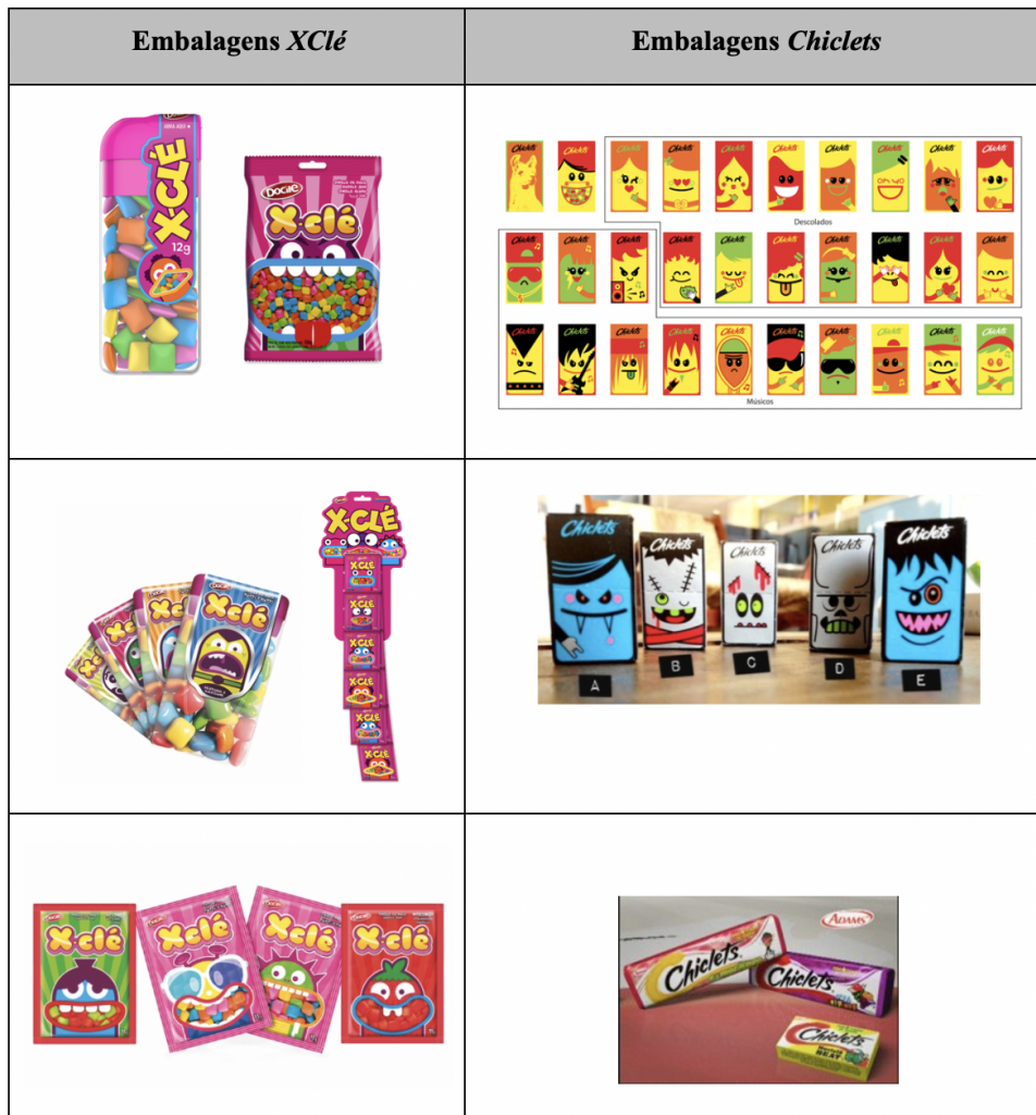
Figura 8. Atuais embalagens disponíveis no mercado (2018).

135 embalagens diferentes designadas pela marca por “Emotigums” como estratégia de estabelecer uma maior proximidade ao público-alvo, os jovens, criando simultaneamente uma maior conexão com as redes sociais.