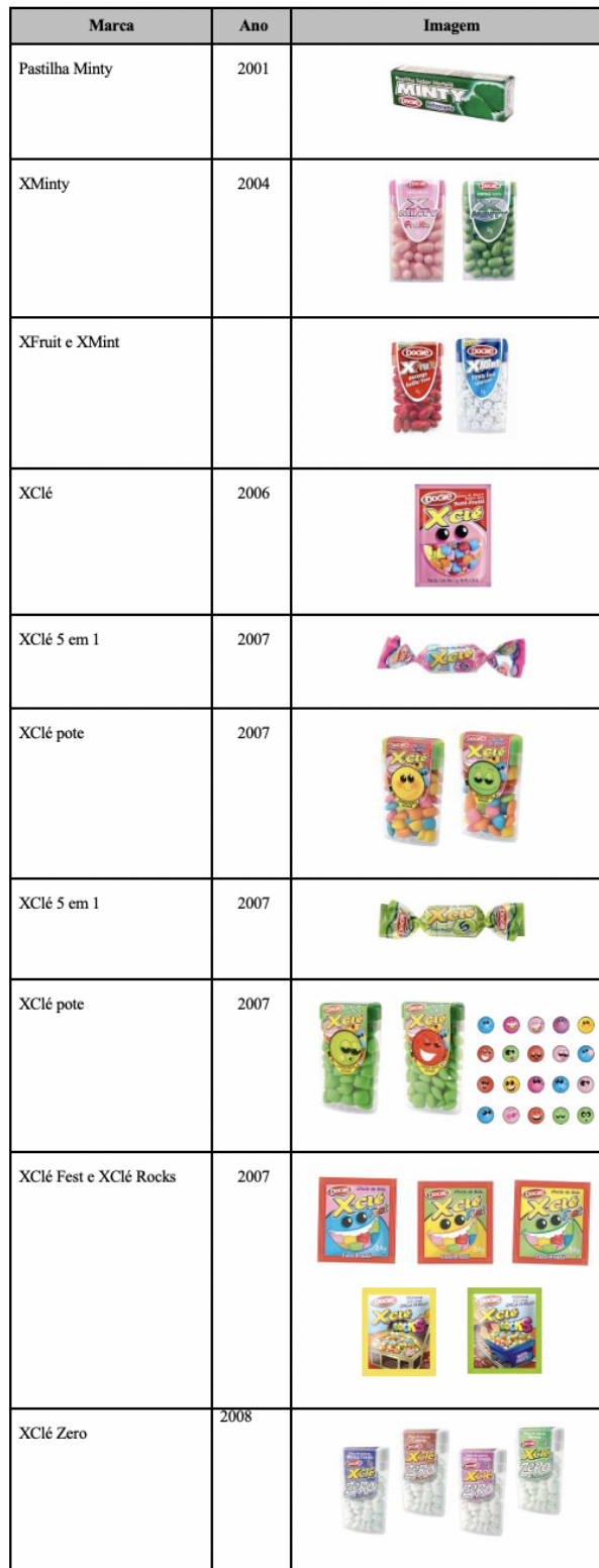
Figura 5. Evolução da Marca XClé. Fonte: Kreutz (2008).

do espaço baseado em arranjos ou organização de artefactos semióticos, sejam estes do modo verbal ou do modo visual (imagem), de forma a captar a atenção e simultaneamente promover a interação com o consumidor (significados interativos).