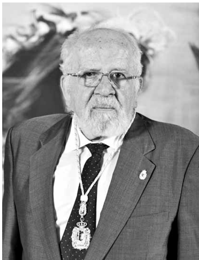
Fig. 12 – Sessão de admisión como académico numerário da Real Academia Galega de Belas Artes (2013)