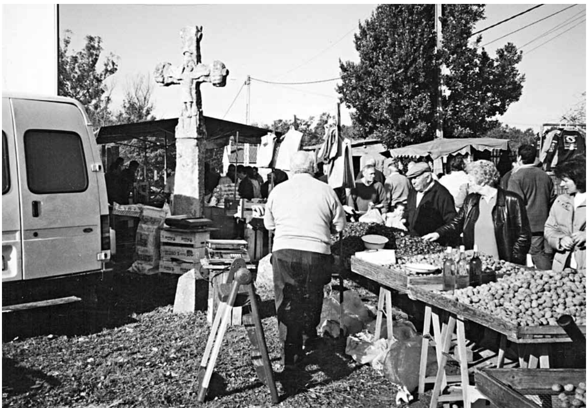
Fig. 2 – Lugar de venda de froitos. Na dereita pode verse a curiosa cruz de pedra de Francos.