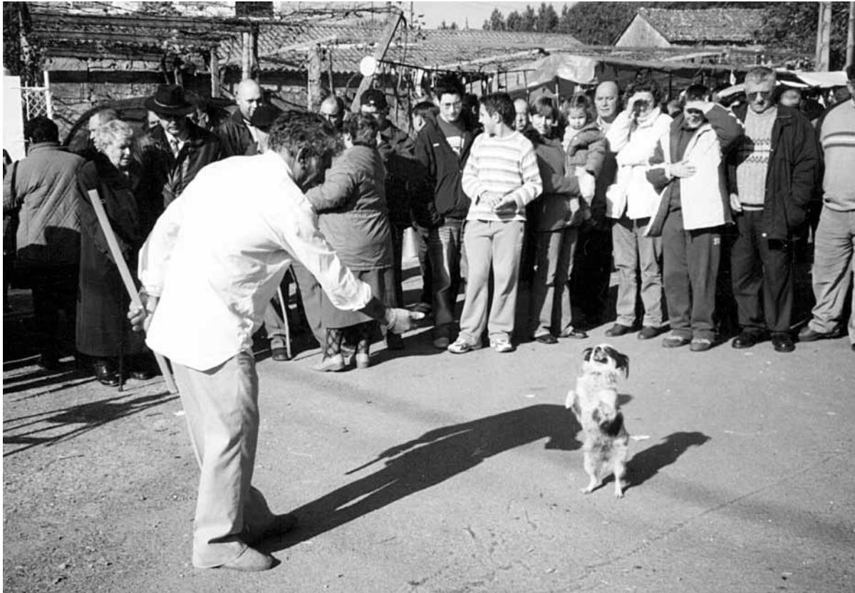
Fig. 7 – O can amestrado dos xitanos en plena actuación.