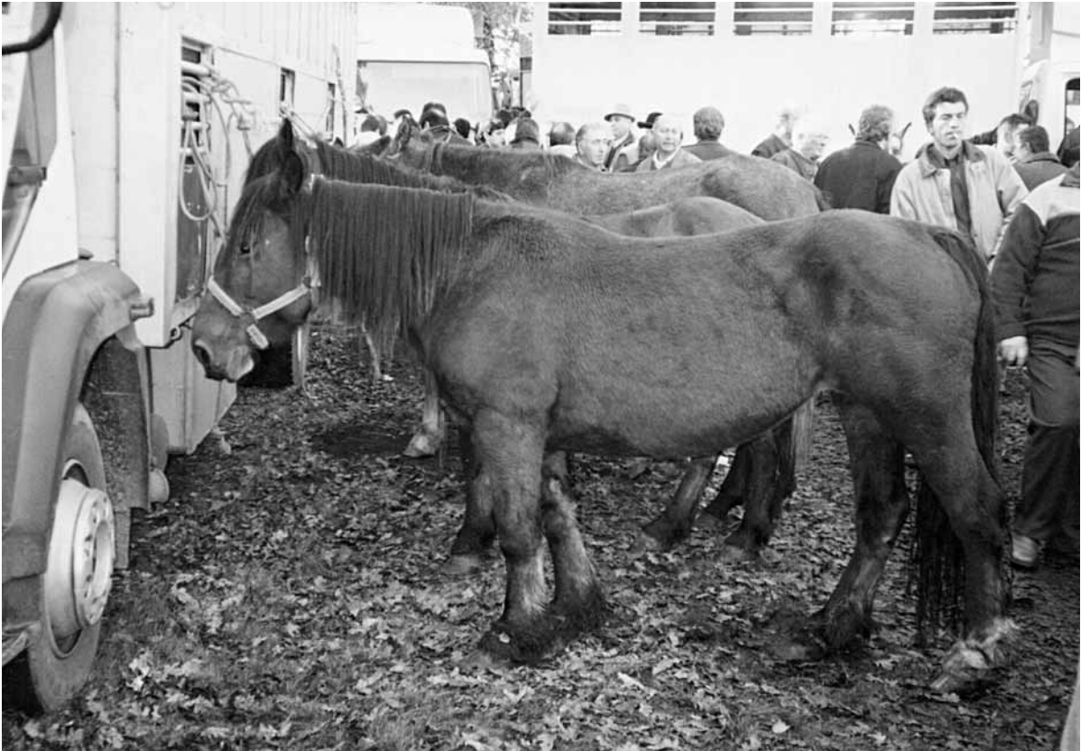
Fig. 5 – Varios animais xa adquiridos e atados a un camión de tratantes.