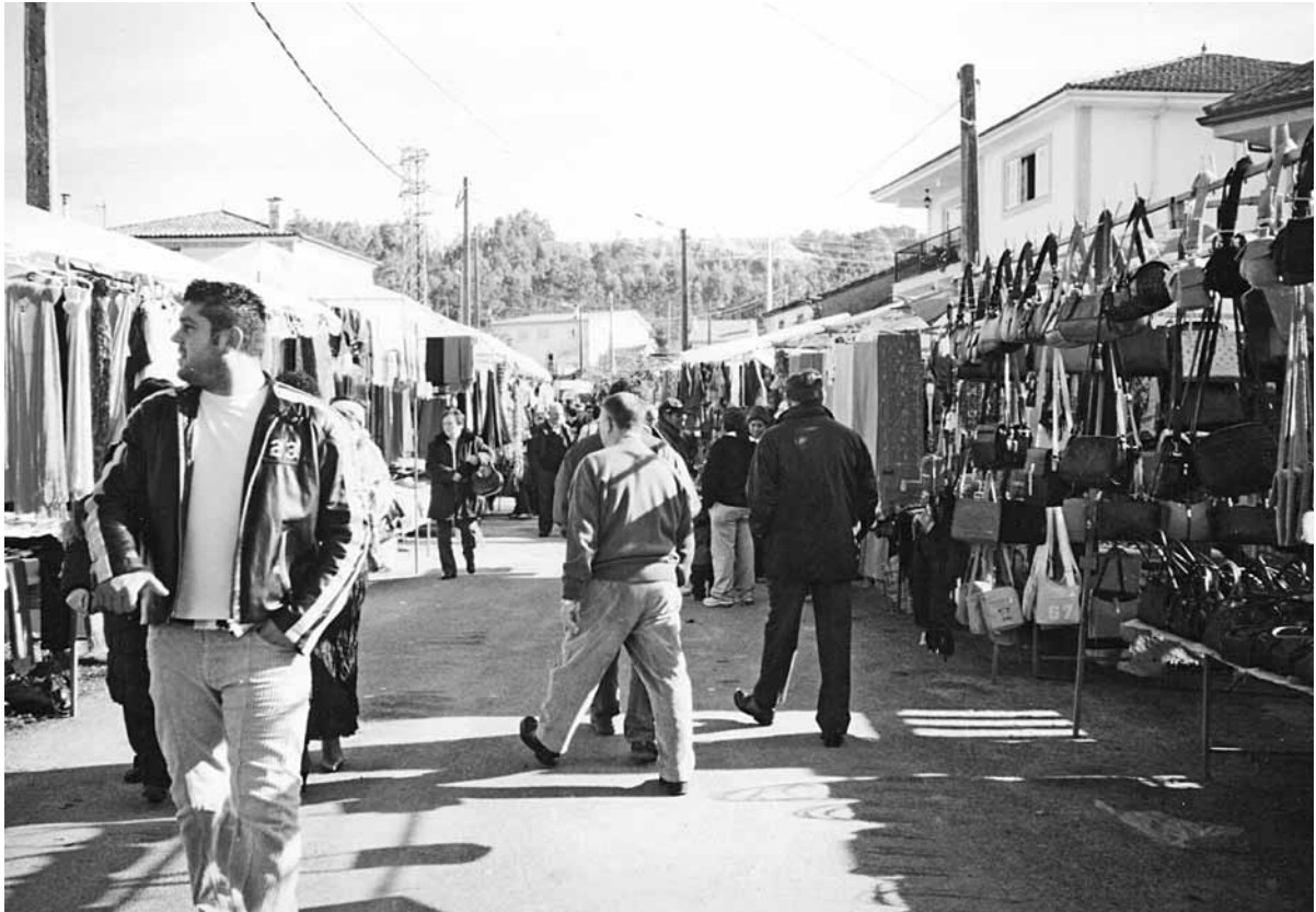
Fig. 1 – Vista da zona onde estaban situados en 2005 os postos de prendas de vestir e complementos.