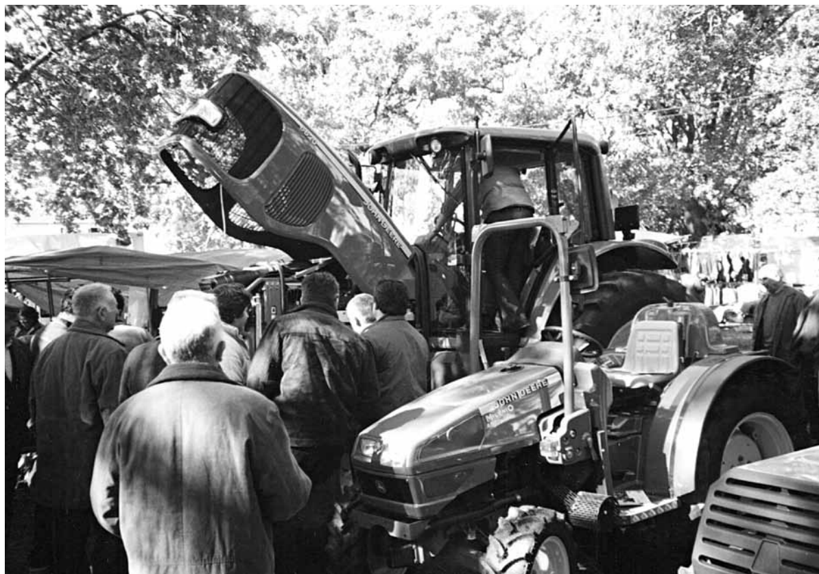
Fig. 3 – A tecnoloxía actual faise presente nos lugares onde se exhibe maquinaria agrícola.