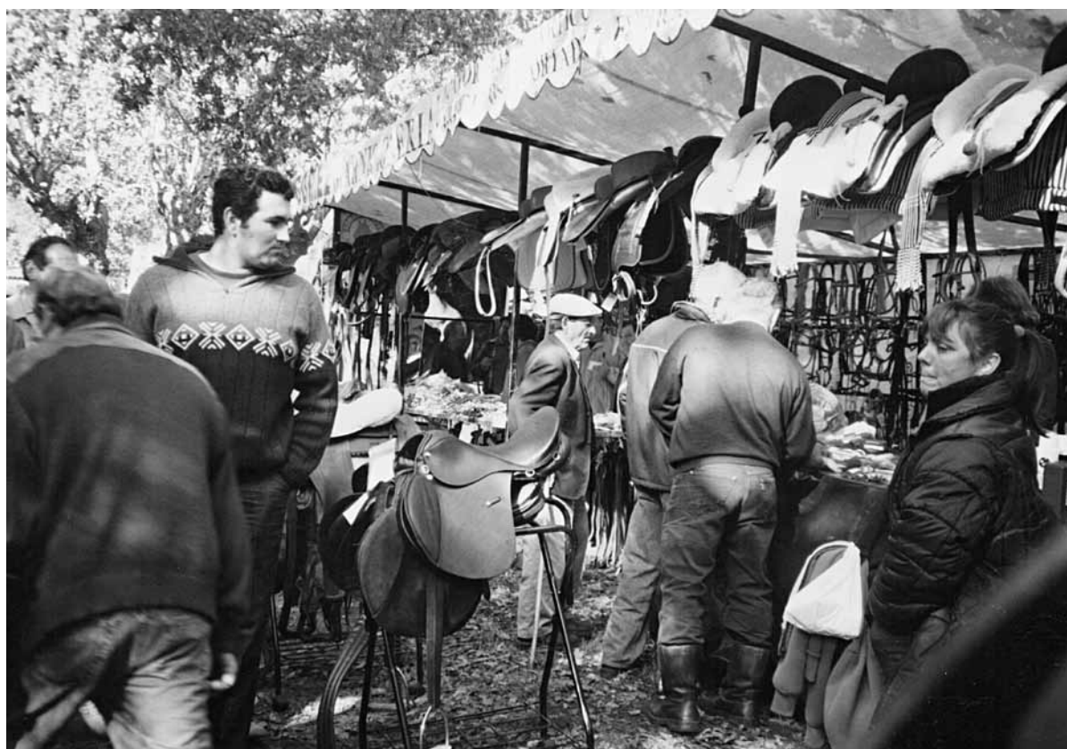
Fig. 4 – Un posto de venda de arreos de cabalerías á entrada da carballeira.