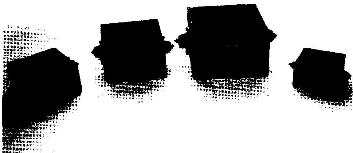
Fig. 3 – Coleção de medidas de secos, de Dom Sebastião, datada de 1575: alqueire , meio alqueire , quarta e oitava . Museu Machado de Castro, Coimbra. Ver secção 7.4.