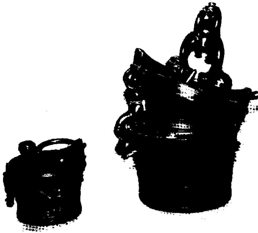
Fig. 2 – Pilhas de pesos de quintal e de arroba, de Dom Manuel I, datadas de 1499; a pilha de quintal só tem as peças de duas arrobas (caixa), arroba e meia arroba . Museu Machado de Castro, Coimbra. Ver secção 7.3.