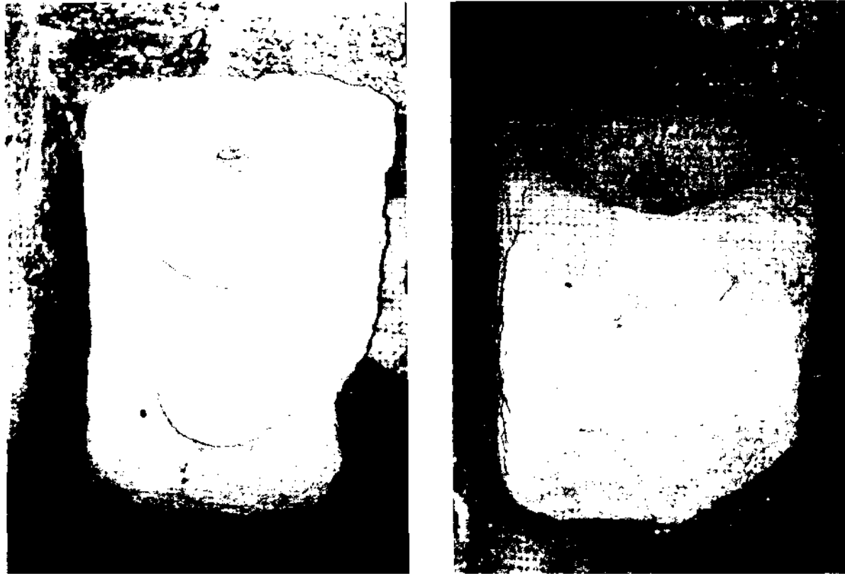
Fig. 1 – O padrão das teigas (século XIV/XV), guardado na igreja de São Miguel do Castelo de Guimarães: vista de topo (à esquerda) e perspectiva (à direita); ver secção 4.6 e, para maiores detalhes, SEABRA LOPES, 2000a, p. 588-589.