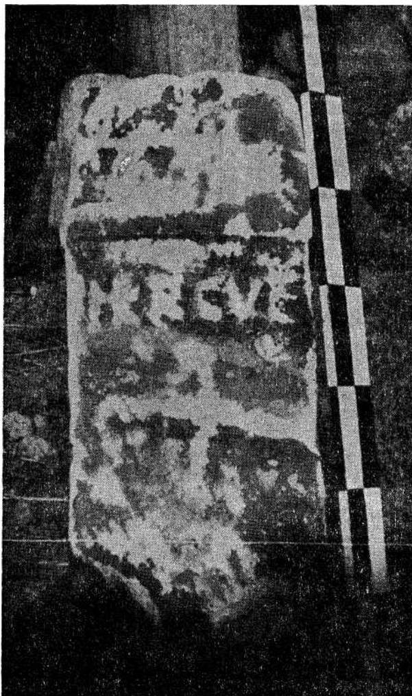
Dimensões: 58 X 22 X 20 cm Campo Epigráfico: 30 X 21 cm Moldura Superior: 22 X 9 cm Altura das Letras: 4 cm

A ara votiva, em granito granuloso da região, está bastante mutilada. Do primitivo fôculo apenas resta uma pequena cavidade circular.