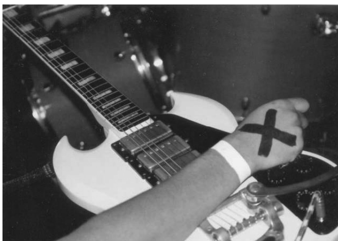
1. O sinal característico dos straight edges .

Essa variante proíbe não apenas a ingestão de carne, mas o consumo de todo e qualquer produto de origem animal ou que esteja vinculado, em seu processo de fabricação e pesquisa, a algum tipo de utilização de animais domésticos ou silvestres. Coerentes com esse princípio, as festas do grupo são denominadas verduradas – em contraposição às costumeiras churrascadadas ou cervejadas. É justamente essa adesão que explica o vínculo aparentemente paradoxal que os straight edge mantêm nada mais nada menos que com os Hare Krishna, muitas vezes encarregados da comida que é servida em suas festas.