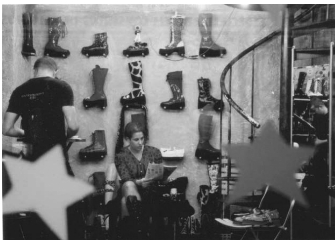
5. Loja de botas Zowie, na Galeria Ouro Fino.

house , com todos os seus matizes em termos de vocabulário oral/gestual/escrito, modelos, cores, marca e composição das roupas, acessórios, penteados, piercings e tatuagens (número, tamanho, formas), idéias, atitudes e opiniões –, não é território exclusivo dos adeptos da música eletrônica. Muitos são os personagens que a frequentam: estilistas em início de carreira, clubbers , tranceiros, techneros, cybermanos ( clubbers de periferia, que vão às raves a pé ou de “condução”), pessoas do bairro, clientes antigos, artistas, gays , pessoal da moda e, mais recentemente, rockeiros e a galera do hip-hop. Dessa forma, a galeria veio a ser não apenas um centro de compras, mas também de convivência: o adjetivo “moderno” que lhe é atribuído representa a vanguarda em moda e comportamento, ditados por um circuito global – Paris, Londres, Nova York, Madri, San Francisco –, que reúne “descolados” e “antenados” com essas tendências.