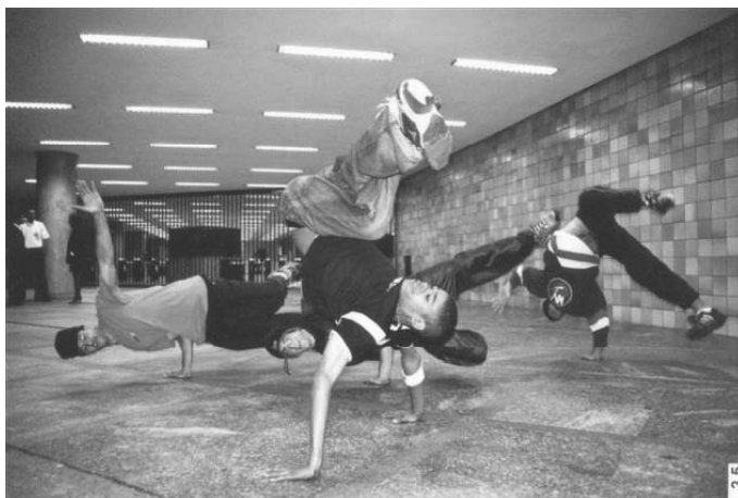
3. B. boys realizam “parada de mão”, movimento de break , durante treino na estação de metrô Conceição.

Os “ japas ” são adeptos da street dance e os “ manos ”, da break dance ; os primeiros são de classe média, descendentes de japoneses, alunos de escolas particulares; os outros, da periferia da zona sul, já no mercado de trabalho.