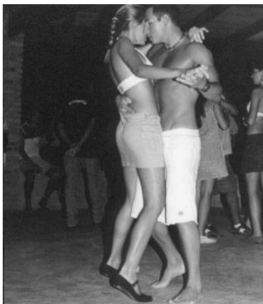
6. Casal dança forró em Itaúnas, Espírito Santo.

litoral norte do Espírito Santo. Conhecer Itaúnas, dançar e tocar em suas praias é tido como um valor para quem curte esse forró. Lá, jovens turistas vindos das capitais do sudeste se encontram e trocam informações, músicas, passos de dança. Nesse encontro, os próprios bailes de Itaúnas, bem como os das cidades de origem desses turistas, se modificam.