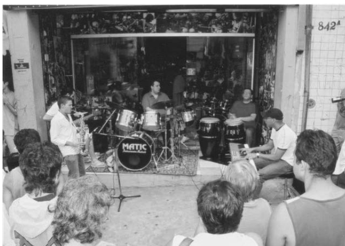
7. Apresentação de jovens instrumentistas em frente à loja Matic Instrumentos Musicais, São Paulo.

Sábado à tarde, rua Teodoro Sampaio, bairro de Pinheiros, zona oeste da capital paulistana: num palco improvisado, na calçada em frente a uma loja de instrumentos musicais, a Matic, “rola” um som especial de música instrumental, caracterizado pela improvisação. Seus protagonistas são jovens que se dedicam de forma individual (não formam bandas) à música instrumental e fazem dela seu meio tanto de lazer e de encontro como de vida. As apresentações nesse local revestem-se de um caráter lúdico e são marcadas por regras particulares: acompanhados pelas namoradas ou esposas, tocam para eles mesmos, para os amigos, exibem sua performance, dão “canjas”; é seu momento de lazer, de construção dos laços e de conhecer outros músicos desse circuito . Perto dali, na praça Benedito Calixto, aumentando o agito, acontece nesse mesmo dia uma concorrida e tradicional feira de antiguidades.