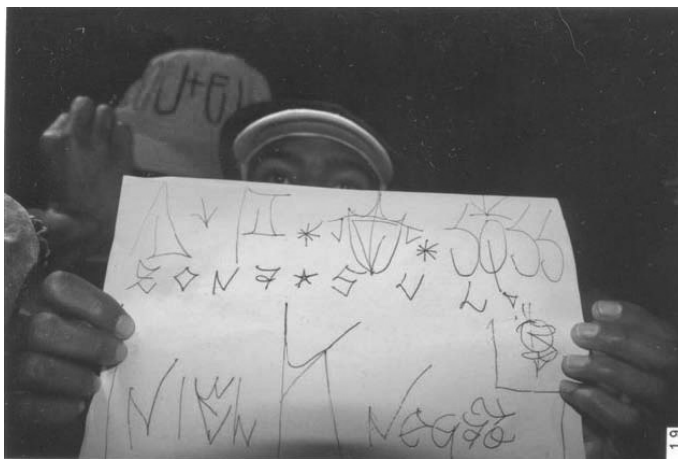
8. Pichador exhibe sua folhinha no point em frente ao Centro Cultural São Paulo.

O principal ponto de encontro dos pichadores paulistanos é o Centro Cultural São Paulo, equipamento da Secretaria de Cultura do município que fica ao lado da estação Vergueiro do metrô. Entre suas funções – biblioteca, espaço de estudo, de ensaios e apresentações teatrais, local de reunião de praticantes de RPG, entre outras –, certamente não estava prevista a de ser um ponto de encontro de pichadores. Até o ano 2000, o “point” dos pichadores localizava-se na ladeira da Memória, local que se tornou impraticável para eles em razão da constante presença da polícia, depois que esse espaço passou por um processo de restauração.