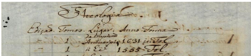
Fig. 2 – Elementos bibliográficos do folio recto

Os documentos são agrupados por áreas de conhecimento, designadas por classes de acordo com o edital: Teologia , Jurisprudência , Filosofia , Matemática , Medicina , História e Bellas letras . Dentro de cada classe, os registos são estruturados por formato e ordem alfabética, assim como o título do catálogo refere.