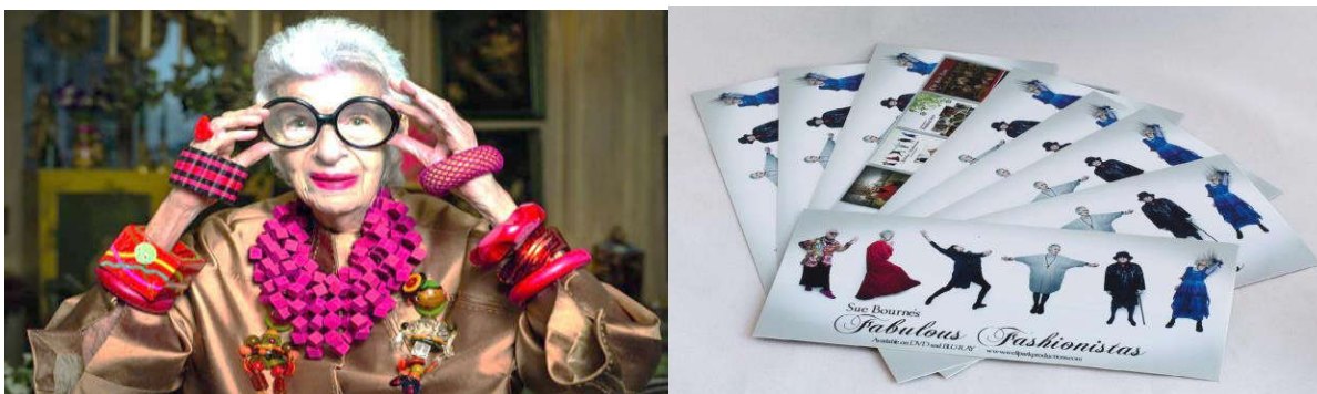
Figura 3 e Figura 4: Iris Apfel, ícone da moda no mundo 36 (esq.) e publicidade 37 do documentário Fabulous e Fashionistas

atividades físicas que podem ter influência no interesse do idoso em buscar moda (vestuário) para a sua idade.