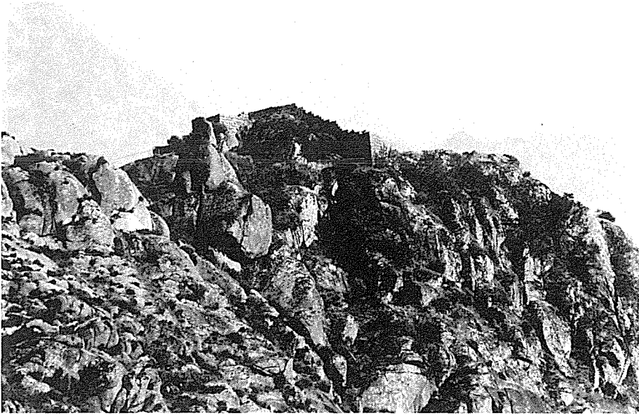
Fig. 1 — Castelo de Castro Laboreiro. Pano da muralha onde se rasga a porta da traição, aberta para norte.